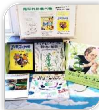
図書館から離れた場所にある 理科室前 学習中の単元に関わる本を展示