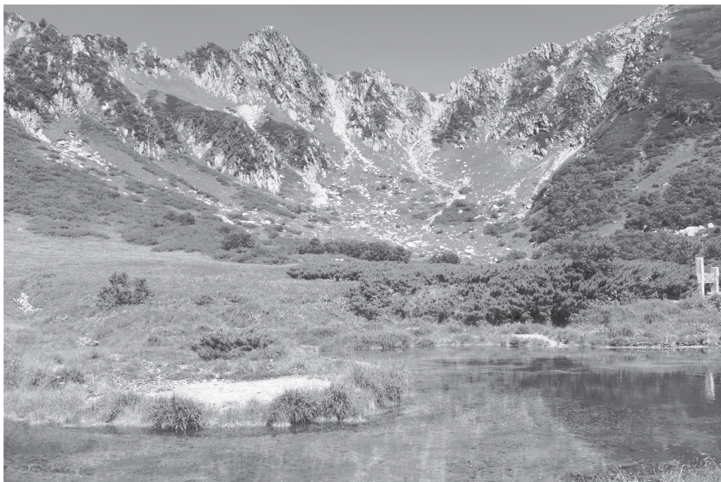
中央アルプス宝剣岳(2931m)と千畳敷カール