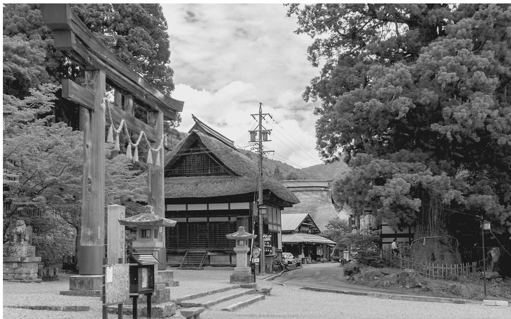
戸隠の町並み (国重要伝統的建造物群保存地区)